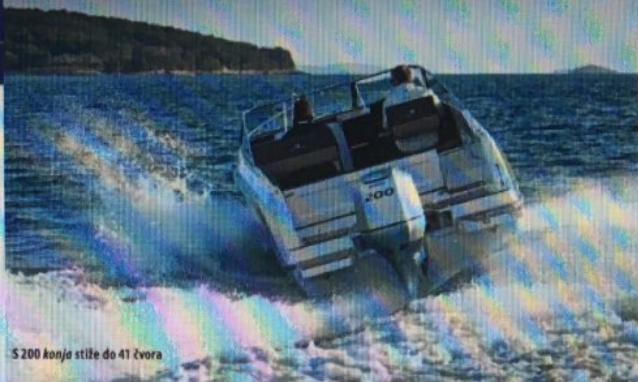
S 200 konja stiže do 41 čvora