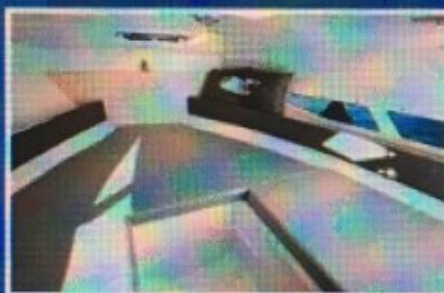
Moderno uređena kabina puna je svjetla