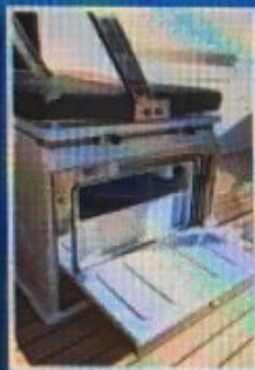
Hladnjak je ispod skiperske klupe