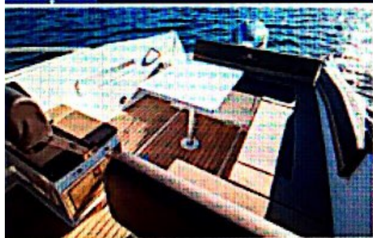
Centralni stol i preklopni nasloni zatvaraju blagovaonicu