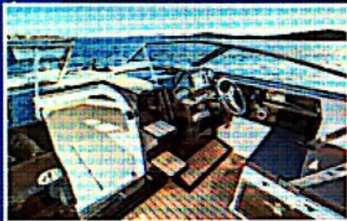
Do pramca vode tri stepenice