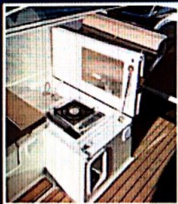
Niski kuhinjski blok ispod sjedala

Prvi sportaš u liniji poljskog proizvođača Sea Life nazvan Atlantic 720 Day Cruiser označava prekretnicu u ponudi toga malog brodogradilišta jer s njime ide uz bok proizvođača poput Quicksilvera, Sea Raya i Jeanneaua. Ta zvučna plovila grade se doslovno u susjedstvu tako da je prijenos informacija i znanja među radnicima nemoguće izbjeći. Za nekoć malu privatnu radionicu iz Augustowa na sjeveroistoku Poljske, sa stotinu zaposlenih, nova klasa je veliki izazov i stoga u svakom detalju nastoje biti na zavidnoj visini. No, troškovi rada i materijala su za sve proizvođače slični i tko želi uložiti više radnih sati u detalje morat će istaknuti i višu cijenu. Zbog toga Atlantic s motorom i cijenom od 50 tisuća eura ne spada u jeftina plovila, no vrlo učinkovito dokazuje zašto su Poljaci cijenjeni u svijetu brodogradnje.