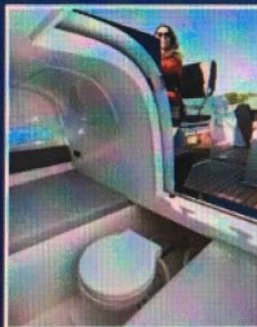
WC školjka ima klizni mehanizam