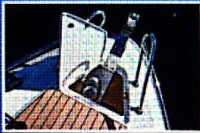
Vitlo je skriveno ispod poklopca