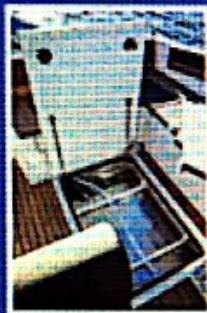
Aluminijski spremnik goriva ima 200 litara