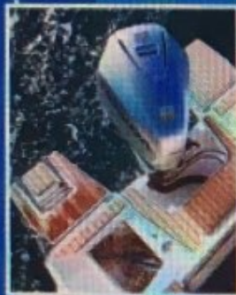
Okolo motora je dovoljno prostora za hodanje