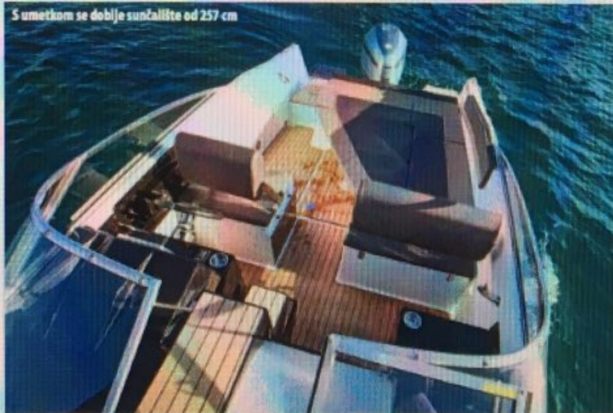
S umetkom se dobije sunčalište od 257 cm

atraktivnost kabine s ležajem dimenzija 210x203 cm (sa središnjim umetkom). Kao suprotnost crno-smeđem kokpitu, presvlake i bočni nasloni u kabini su izvedeni u sivim tonovima. Za noćne sate na raspolaganju su dvije LED svjetiljke, a za višak stvari tri spremnika ispod podnice kreveta. Pogled na unutrašnju strukturu otkriva nešto drugačiji koncept orebrenja zaslužan za uštedu na težini pa tako ovaj model ima 1380 kilograma što je 300 manje nego Suncruiser sličnih gabarita. To se prilično osjeti na poletnosti jer ugrađenih 200 "konja" nije ni blizu dopuštene maksimalne snage od 300 KS. Ni očekivanja stoga nisu bila prevelika, no pokazalo se kako je to dovoljno za sportski doživljaj za timunom i potrošnju od litre po milji u brzinskom rasponu od 20 do 30 čvorova. Na punom gasu smo postigli brzinu od 41 čvora, no više od svega nas je ugodno iznenadila reakcija na gas, rezultat usklađene propele, trupa i visine montaže. Iz mjesta do glisiranja stiže za manje od tri sekunde i u oba smjera se okreće gotovo u mjestu bez hvatanja zraka. Uz dobro pozicioniranu ručicu gasa, udoban kožni volan i oslonac za noge zabava je zajamčena.