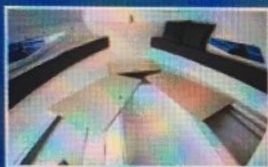
Ispod kreveta su dodatni spremnici