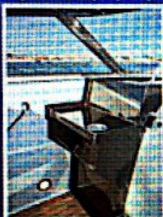
Police u crnom kožitu