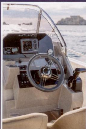
Okomita komandna ploča je vrlo pregledna

Prije nego što na tržište plasiraju novi model proizvođači dobro oslušuju što im radi konkurencija. Jedan od malih škverova na izvoru informacija je poljski Sea Life , kod nas poznatiji kao proizvođač glisera Atlantic Marine . Naime, u njihovoj blizini su pogoni Jeanneau i Brunswicka pa najbolje znaju što se novoga sprema u najvećim nautičkim kužinama. Velika gužva u šesnaestercu je dovela do toga da su razlike među pojedinim modelima toliko male da na kraju često presuđuju pregovaračka vještina lokalnog dilera i sitni darovi u obliku dodatne opreme. Promatrajući hrvatsko tržište, vrlo traženi su radni brodovi za jednodnevno iznajmljivanje i prijevoz turista. Najveća zamjerka korisnika je bila ograničene broja putnika zbog kojeg su često bili u prekršaju. Poljaci su stoga tržištu ponudili otvorenu verziju Sundecka 730 nazvanu Atlantic Open 750 registriranu za čak 12 osoba. Za brod dužine 7,70 metara to je izvanserijska nosivost i sigurno će zaintrigirati mnoge iznajmljivače. Pogotovo bi ih mogla impresionirati tvornička cijena od 23 tisuće eura, odnosno s V6 motorom i porezom bi sve zajedno iznosilo oko 50 tisuća eura.