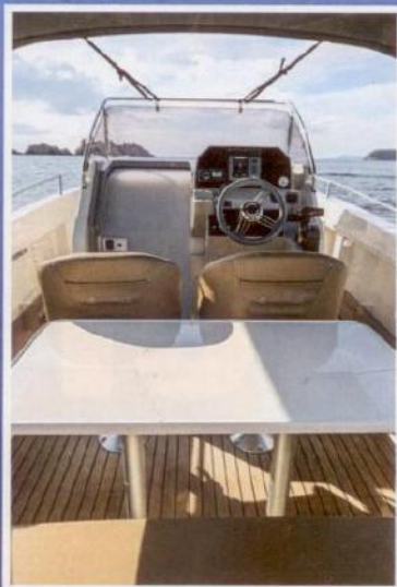
Stol u kokpitu ima dvije noge