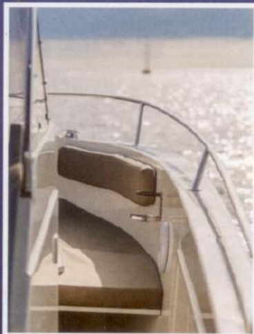
Bočni prolazi su široki 38 centimetara