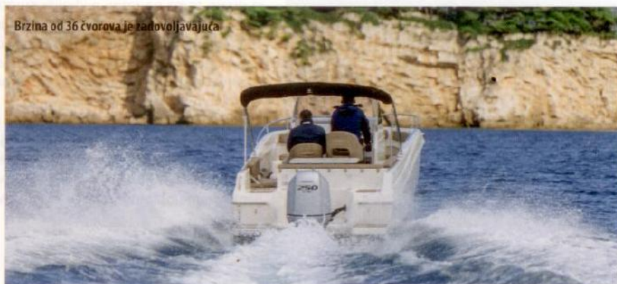
Brzina od 36 čvorova je zadovoljavajuća

Nakon odrađenog cjelodnevnog testiranja bili smo sasvim zadovoljni s doživljenim impresijama. Visoka razina kvalitete plastike i jednostavna rješenja bez neugodnih iznenađenja ono su što profesionalni nautičari najviše cijene, a poljsko podrijetlo je već odavno postalo vrlina. ■