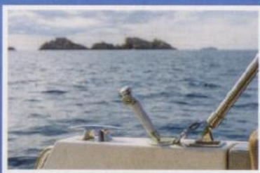
Tuš na krmi je vrlo tražen artikal