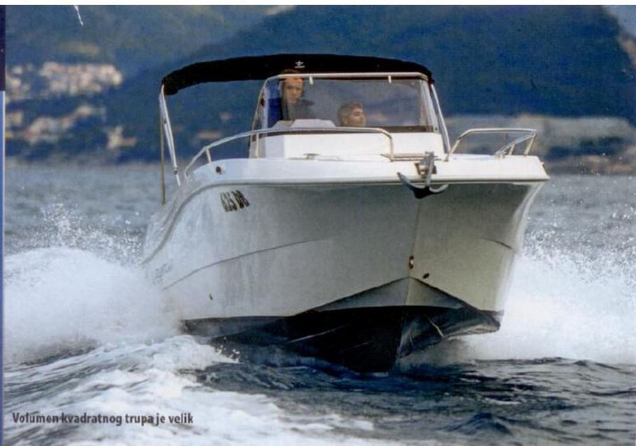
Volumen kvadratnog trupa je velik

su postavljena dva zračna odušnika i dvije LED svjetiljke. U slučaju da se prostor uredi za spavanje bilo bi korisno napraviti barem mali prozor. Svakako je preporučljivo napraviti pregrade i mrežaste nosače za najbolje iskorištenje prostora.