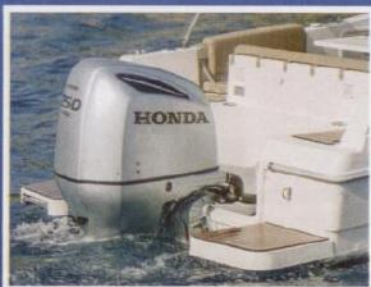
Uz motor su tikom obložene platforme