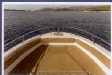
Bočne obloge podižu razinu udobnosti