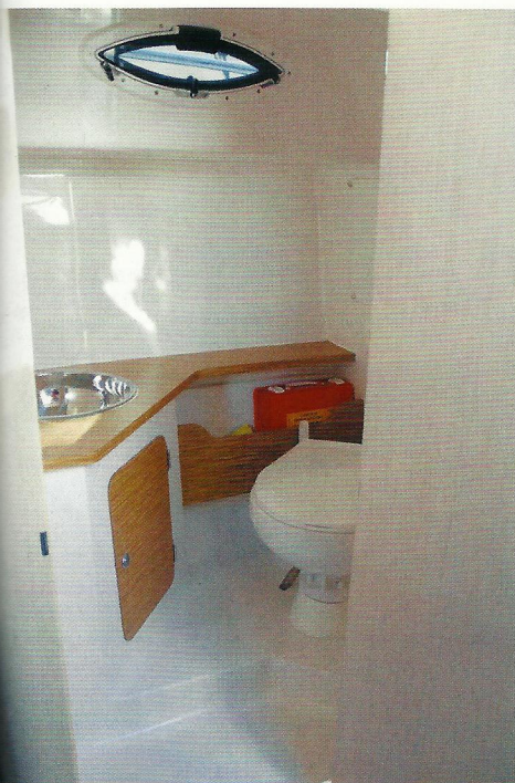
▲ Toaletni prostor s umivaonikom odvojen je i zadovoljavajuće velik

toaletni prostor. Tik do ulaznih vrata s lijeve strane smještena je kuhinjska površina. U testiranom Atlanticu ispod te radne plohe bio je samo frižider, no po zahtjevu kupaca tu se može ugraditi i kompletna mala kuhinja. Nasuprot kuhinje nalazi se odvojeni ali zadovoljavajuće prostrani toaletni prostor.