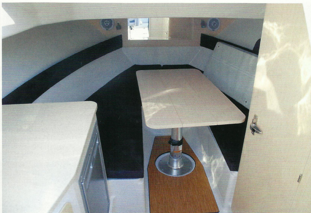
▲ Spuštanjem stola nastaje ležaj za dvije odrasle osobe i jedno dijete

U našem slučaju na krmi je bilo 250 Hondinih konja. Radi se o vrlo snažnom i tehnološki filigranski izbrušenom motoru koji u najboljem svjetlu pokazuje što sve može moderna tehnologija na moru. Precizno elektroničko ubrizgavanje goriva, VTEC sustav varijabilnoga