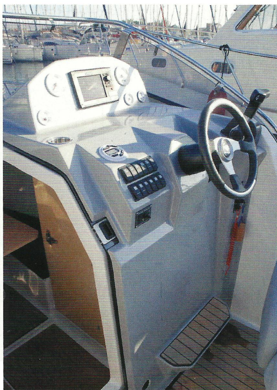
▲ Asimetrični prolazi pored konzole vode do kokpita. Lijevi prolaz je širok, desni tek dovoljan