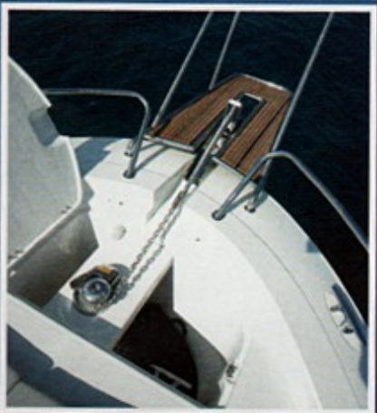
Sidro i lanac su provedeni kroz procjep u pramcu