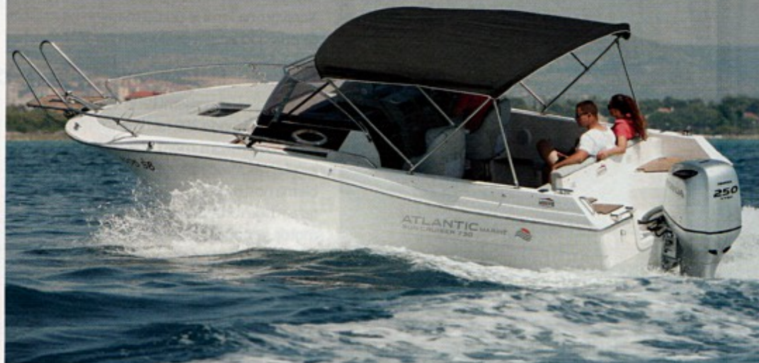
Tenda prekriva cijeli kokpit

No, kad se praznina u slovu L popuni s umetkom dobije se vrlo zanimljiv ležaj za dvoje. Uz zatvaranje bočnih stranica tende u ljetnim mjesecima se tu može i prenočiti što udvostručuje smještajni potencijal nevelikog Atlantica .