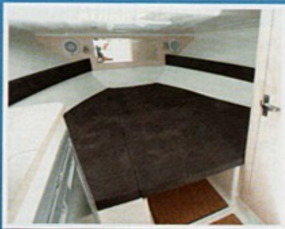
Unutrašnjost je lijepo uređena