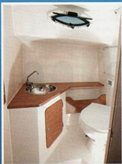
Odvojeni toaletni prostor oplemenjen je drvom