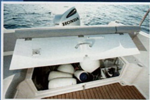
Pod krmenom klupom je veliki spremnik