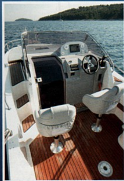
Tikovina podiže ukupan dojam

poklopca je električni vinč na poprečnoj dasci, te zanimljiva dodatna bitva.