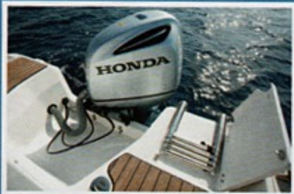
Ljestve su skrivene ispod poklopca s tikovinom